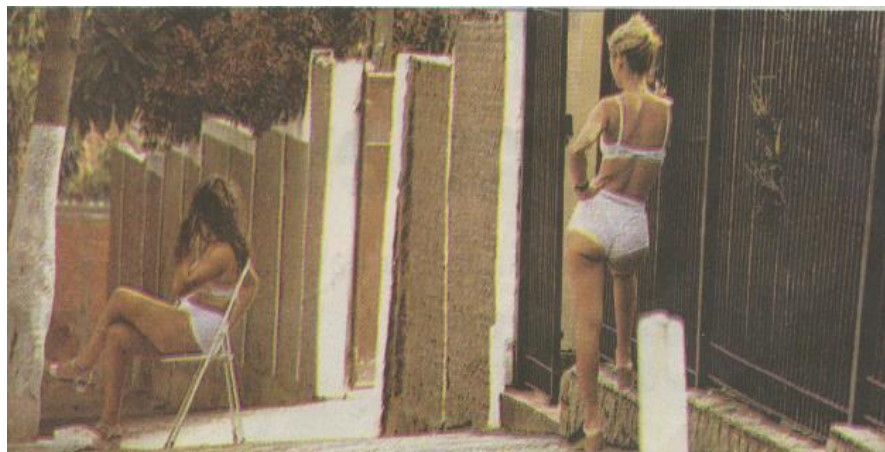
Figura 3: Prostitutas em trajes íntimos, 1998