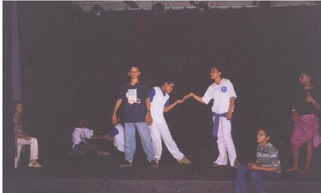
FIGURA 18: Ensaio no teatro do Clube Sesi