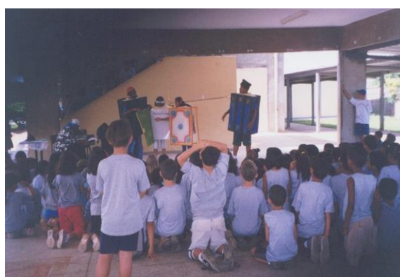
FIGURA 27: Apresentação da peça