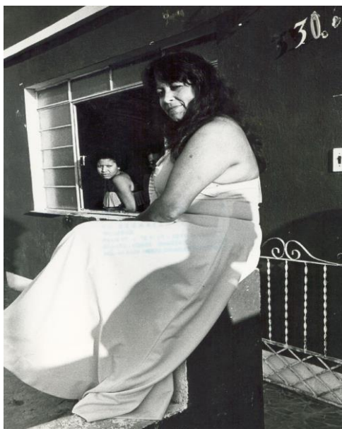
Figura 1: Prostituta de vestido longo, 1977 Figura 2: Prostitutas com roupas informais, 1986

Lembro-me dos tempos em que isso aqui tinha classe. Os homens eram chamados de cavalheiros e as meninas de damas. Não havia exibição nas portas das casas que eram quase todas fechadas. Para entrar, o cliente tinha de bater à porta e só frequentava a zona do meretrício vestido devidamente, de terno e gravata. Eram homens da sociedade. De respeito. Ninguém chegava aqui de chinelos de dedo, bermuda ou sujo de graxa como vemos pelas ruas do bairro (Entrevista de uma prostituta ao jornal CORREIO POPULAR, 1998, p.10) - Figura 3.