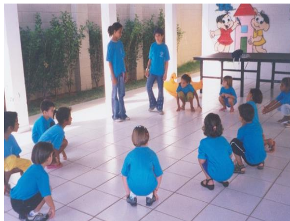
FIGURA 30: Adolescentes com as crianças de 4 a 6 anos