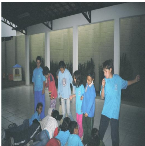
FIGURA 16: Atividade no pátio coberto