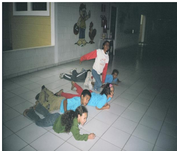
FIGURA 17: Atividade no pátio coberto