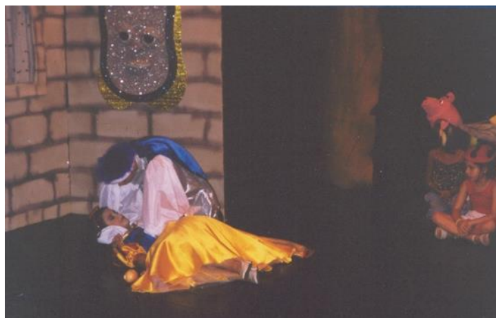
FIGURA 6: Peça teatral “Branca de Neve e os 7 anões”

Outro problema que permeava todo trabalho com o grupo era o fato dos componentes viverem numa zona de prostituição. A maioria dos adolescentes mora no Jardim Itatinga e demonstra a revolta por serem obrigados a conviver com um ambiente promíscuo e violento. Alguns não conheciam o centro da cidade de Campinas e todos foram unânimes em dizer que não conheciam um teatro. Propus então nos deslocarmos até o Bosque dos Jequitibás, localizado na área central da cidade, para assistirmos a peça “Branca de Neve e os 7 anões”, que estava em cartaz no teatro Carlos Maia, dentro do bosque. Na visita eles puderam conhecer a parte física do teatro e o elenco. Alguns adolescentes foram escolhidos para atuarem como figurantes, como anões ou animais da floresta (Figuras 6 e 7). Os demais ficaram concentrados a cada detalhe da peça (Figura 8). Complementamos o passeio admirando a magnífica natureza existente no bosque (Figura 9). Posteriormente, vários itens do espetáculo foram analisados, tais como: a atuação dos atores, o figurino, o cenário, os adereços e a reação das crianças na platéia.