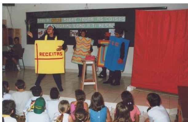
FIGURA 28: Apresentação da peça