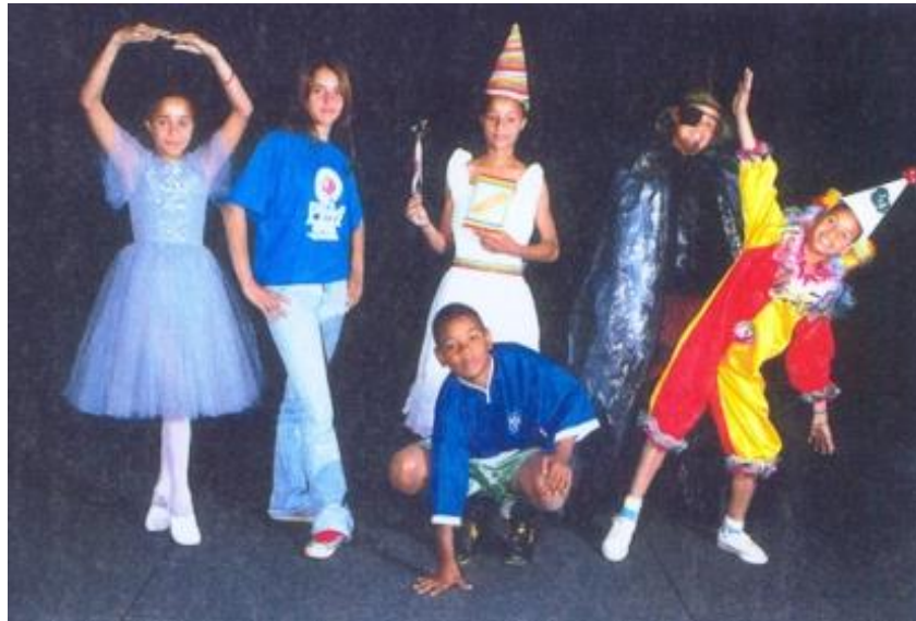
FIGURA 33: Elenco da peça “A vida é uma festa”