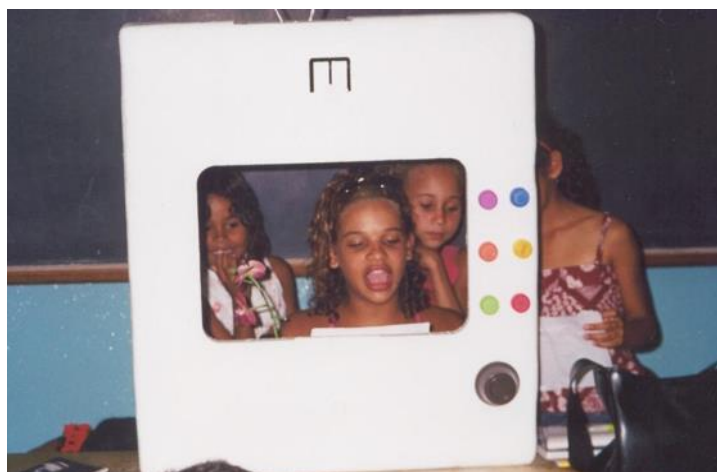
FIGURA 4: Telejornal

Pude comprovar todos os conhecimentos teóricos sobre a máscara na terapia, durante as sessões com os adolescentes. Eles sentiram-se livres e começaram a representar, demonstrando grande satisfação na realização desta atividade. Este foi o primeiro sinal de que a representação teatral poderia fazer parte também das atividades pedagógicas desenvolvidas naquela instituição. Certo dia, como dinâmica de leitura propus que eles fossem até os tonéis de sucata para escolherem reportagens de jornais para ler, resumir e contar para os colegas da sala de aula. No primeiro dia limitaram-se a esta ação, mas ao encontrarem assuntos que realmente lhes interessavam, como: futebol, beleza e notícias de fatos violentos da região, os 5 integrantes da arte-terapia deram a idéia de fazer um telejornal. Construíram então uma televisão de isopor (figura 4) e aos poucos foram se unindo por interesses de leitura e começaram a dramatizar os fatos lidos. Eu os filmava e depois cada um fazia uma avaliação de todo processo.