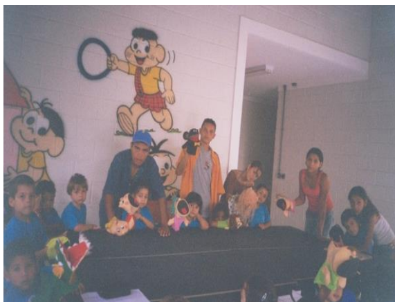
FIGURA 29: Adolescentes com as crianças de 4 a 6 anos

Quanto mais conscientemente faça a sua História, tanto mais o povo perceberá, com lucidez, as dificuldades que tem a enfrentar, no domínio econômico, social e cultural, no processo permanente da sua libertação. Fazer a história é estar presente nela e não simplesmente nela estar representado (FREIRE, 1981, p. 41).