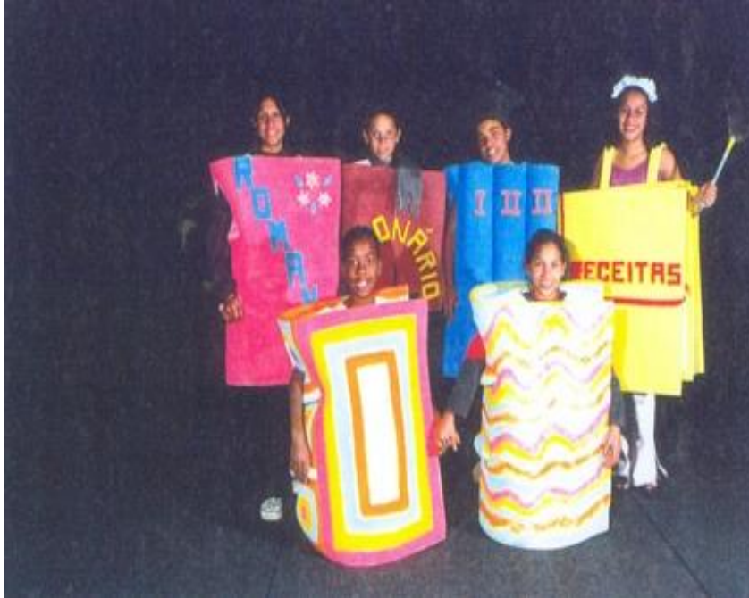
FIGURA 5: Elenco da peça O Mundo do Livro