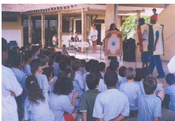
FIGURA 26: Apresentação da peça

que utilizei durante a montagem, os quais a Trupe irá oferecer também como opção, com um acréscimo no preço por este novo serviço. Quando eles chegam das escolas onde se apresentaram, organizam todos os materiais que foram utilizados, guardando-os numa sala própria do grupo de teatro, dentro do CEPROMM. A divisão do cachê que ganham é feita, de acordo com os percentuais que já foram definimos anteriormente no grupo.